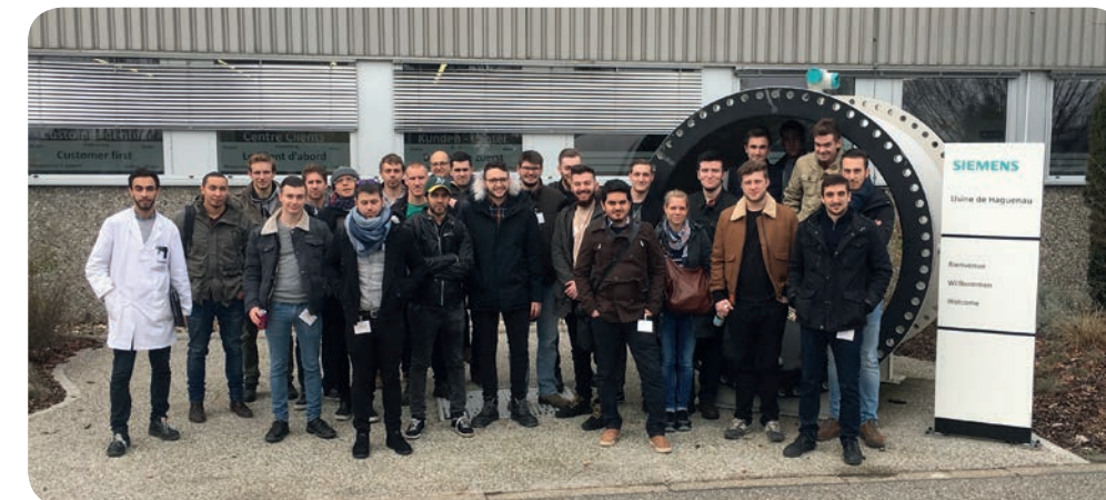
Visite du site Siemens Haguenau