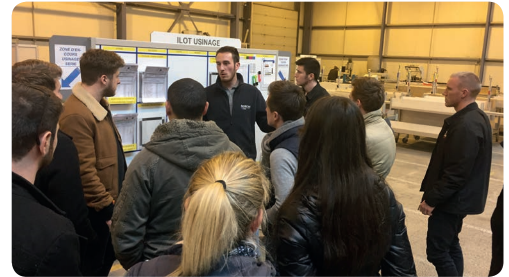
Présentation du management visuel chez Norcan

Les étudiants en apprentissage en seconde année au sein de la formation de Master Sciences pour l'Ingénieur, Spécialité Génie Industriel – Production Industrielle, ont visité 14 entreprises dont 9 industries technologiques adhérentes à l'UIMM Alsace (respectivement : Lohr Industrie (Duppigheim), Sarel (Sarre-Union), Safran (Molsheim), Seco-EPB (Bouxwiller), Kuhn (Saverne), Siemens (Haguenau), Norcan (Haguenau), Socomec (Huttenheim) et Bürkert (Triembach au Val).